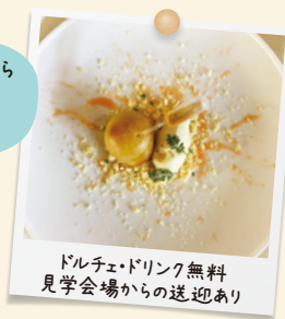
ドルチェ・ドリンク無料 見学会場からの送迎あり